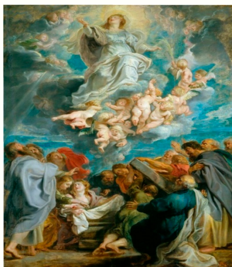
Imagem 4: RUBENS, Peter Paul. Assunção da Santíssima Virgem Maria , 1626 12 .