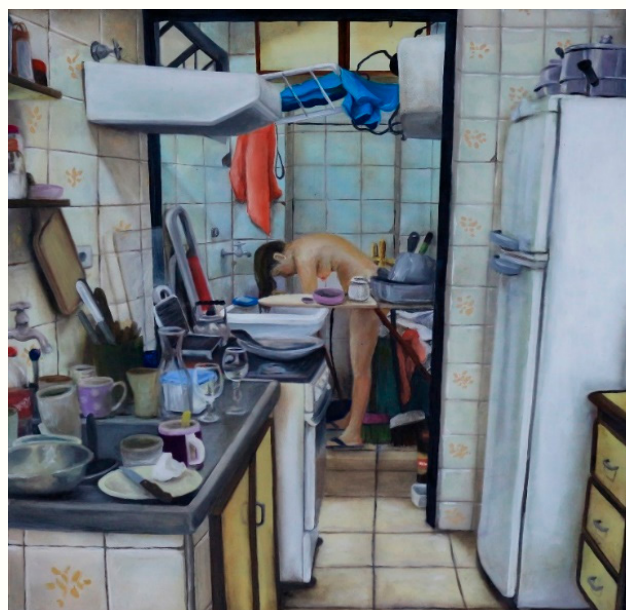
Imagem 7: PESSOA, Priscilla. João. 2014, óleo s/ tela, cm.

O Batismo de Cristo (Imagem 6): um retrato da divindade de Jesus. Os céus abertos com o irradiar do Espírito Santo e o próprio Deus Pai como espectador de um episódio marcante na História da Salvação. Os rostos angelicais, não só dos anjos, mas também dos humanos ali presentes e o azul radiante do espetáculo celeste, um momento que contrasta com a materialização daquele que se fez de carne e osso e teve seu corpo desgraçadamente torturado.