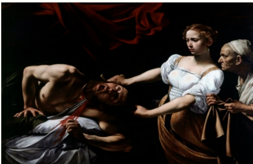
Imagem 10: CARAVAGGIO. Judite e Holofernes , 1599, óleo s/ tela, 144 cm x 195 cm 19 .