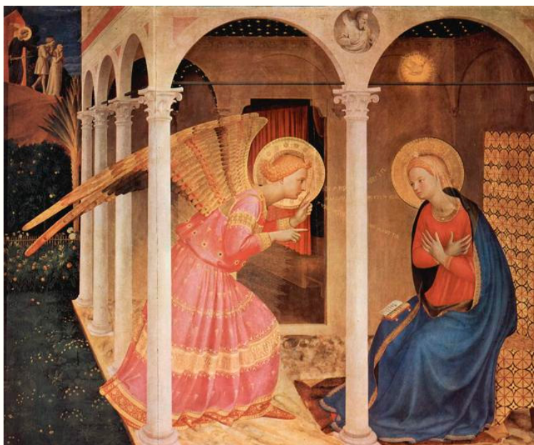
Imagem 1: Fra Angélico. A Anunciação , 1434, têmpera sobre madeira, 160 x 180 cm. Museu Curico, Cortona, Itália 8 .