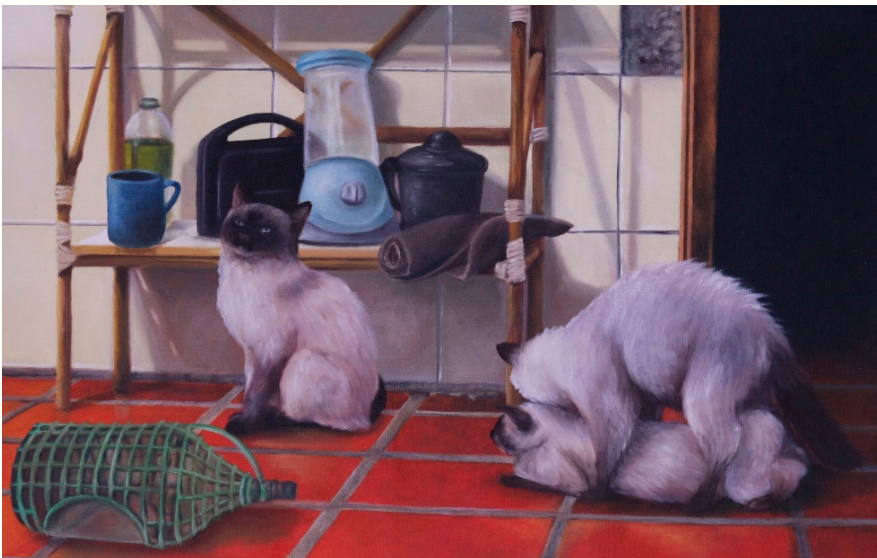
Imagem 8: PESSOA, Priscilla. Ló e suas filhas . 2014. Óleo s/ tela. 38x55cm.

Em João (Imagem 7) aparentemente Priscilla mostra a mesma kitnet da pintura A Assunção (Imagem 5). Mas dessa vez há mais detalhes na imagem. Até chegar na mulher que parece estar lavando o cabelo, nossos olhos precisam caminhar pelos azulejos, as várias louças sujas, as gavetas, a geladeira, a tábua de passar e um monte de outras coisas que formam o recorte desse momento corriqueiro. Enquanto João batizava o Messias num evento único na história, a mulher está fazendo algo que será refeito várias outras vezes. Não se ouve uma voz dizendo "Essa é minha filha amada que me traz muita alegria" 15 . A cada manhã o Espírito Santo não pode aparecer como pomba luminosa, até porque mesmo uma pomba poderia tornar a casa apertada demais. A única forma do Espírito aparecer aqui é se infiltrando no meio da bagunça inevitável, da falta de tempo e da angústia diária para a qual provavelmente não há resolução definitiva.