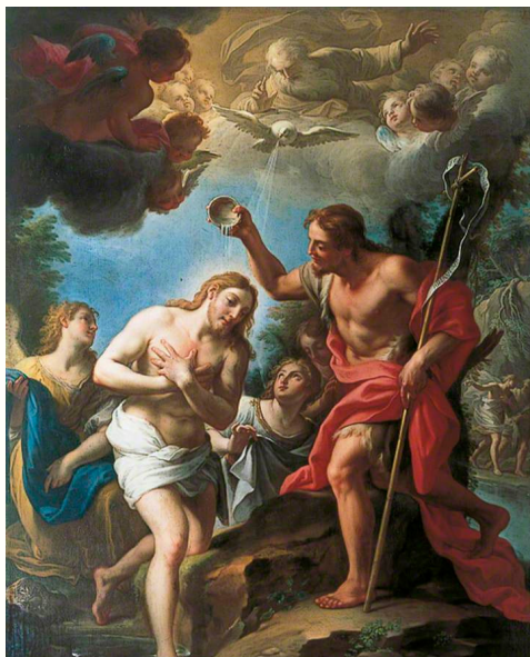
Imagem 6: TREVISANI, Francesco. S.d. O batismo de Cristo. Newsan House, Inglaterra 14 .

bem diferentes das primeiras e quebrem a monotonia ou pelo menos, seja lá o que existe além da tediosa matéria, ilumine os corpos que precisam lidar com os afazeres inesgotáveis da vida. Ou podemos dizer: é apenas mais uma mulher estendendo roupa.