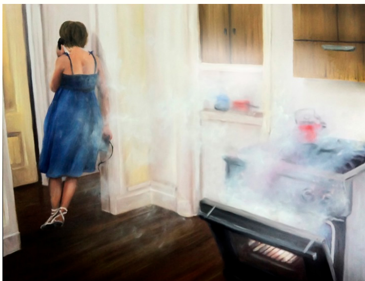
Imagem 2: PESSOA, Priscilla. Anunciação , 2012, óleo s/ tela, 44,5x57cm.

A Anunciação (Imagem 1) de Fra Angélico, apesar de ser da Primeira Renascença (1400 – 1475), apresenta as mencionadas cores simbólicas tradicionais e as auréolas que divinizam os personagens da pintura. Além disso, a perspectiva dimensional da imagem e os elementos inertes que fazem fundo à cena principal, trazem a caracterização de um mundo platônico, distante do cotidiano humano. O episódio do evangelho de São Lucas 9 onde o anjo Gabriel diz a Maria que ela engravidaria de Jesus, mostra uma manifestação do sobrenatural na vida de uma simples moça, de um povoado sem importância 10 . Nessa imagem, no entanto, torna-se mais notória